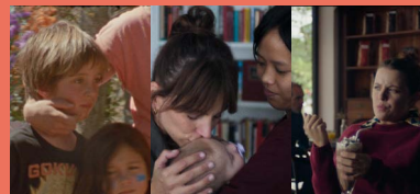
DOL I FA SOL